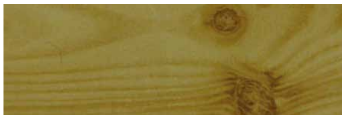
KROK 3: Powlekanie aluminium