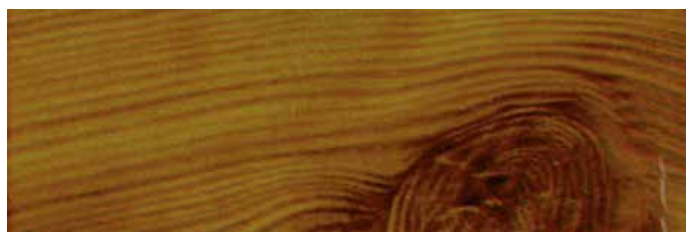
KROK 4: Gotowy wzór na aluminium