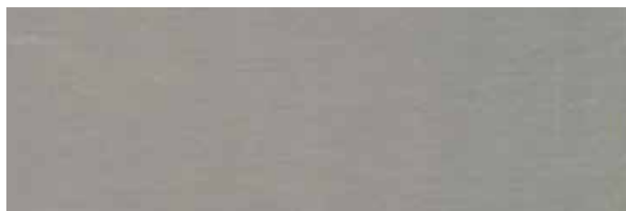
KROK 2: Wstępna obróbka aluminium