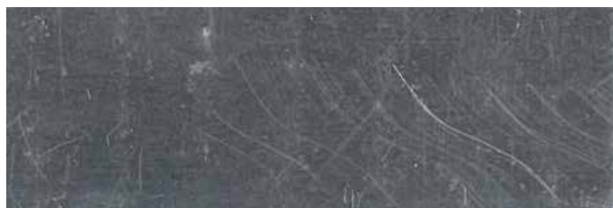
KROK 1: Surowe aluminium